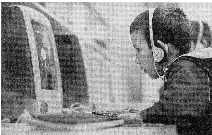
„Ein Schüler lernt am Computer Englisch-Vokabeln“ (Neue Zürcher Zeitung vom 20. 4. 2004)